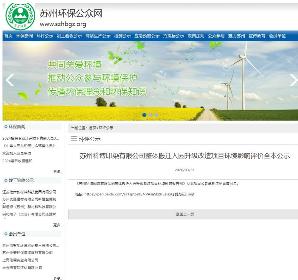
图 6-1 批前网络公示

按照《环境影响评价公众参与办法》（部令 第4号）的相关要求，本项目于2026年3月31日在苏州环保公众网（ https://www.szhbgz.org/huan_detail.aspx?ID=2111 ）对该项目环境影响评价进行了公示。网上公示截图见图6-1。