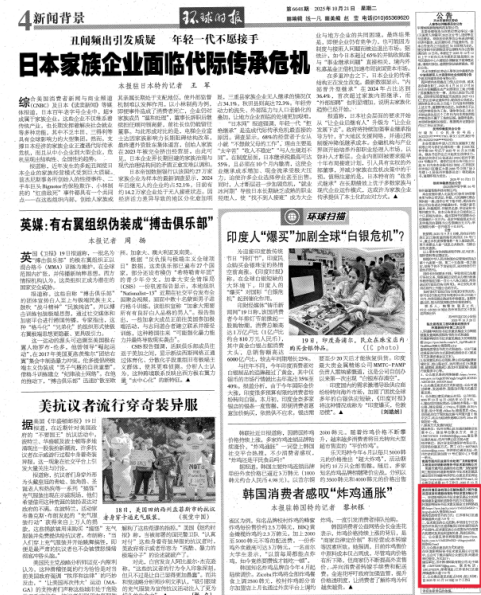
图 3-2 报纸第一次公示