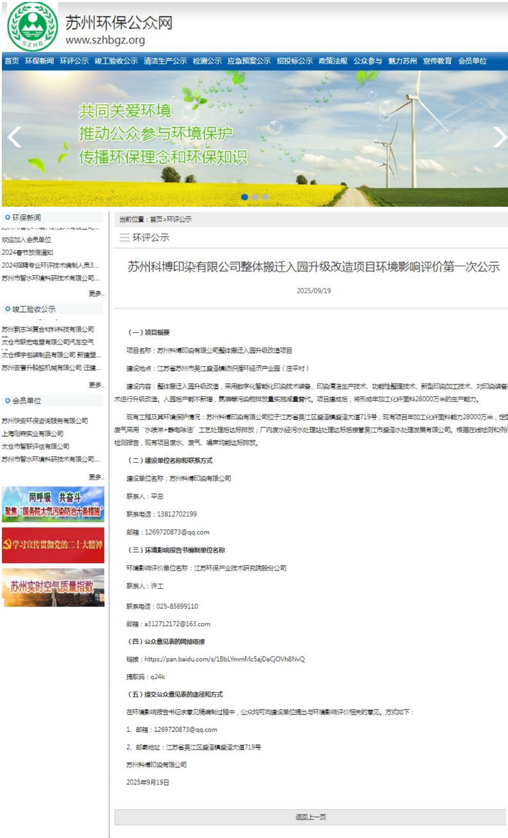
图 2-1 第一次网上公示截图