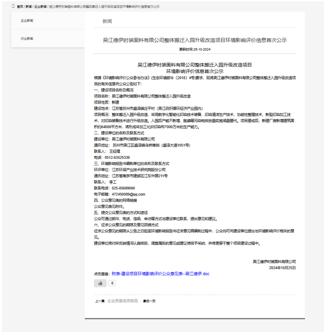
图 2.2-1 吴江德伊时装面料有限公司网站公示截图