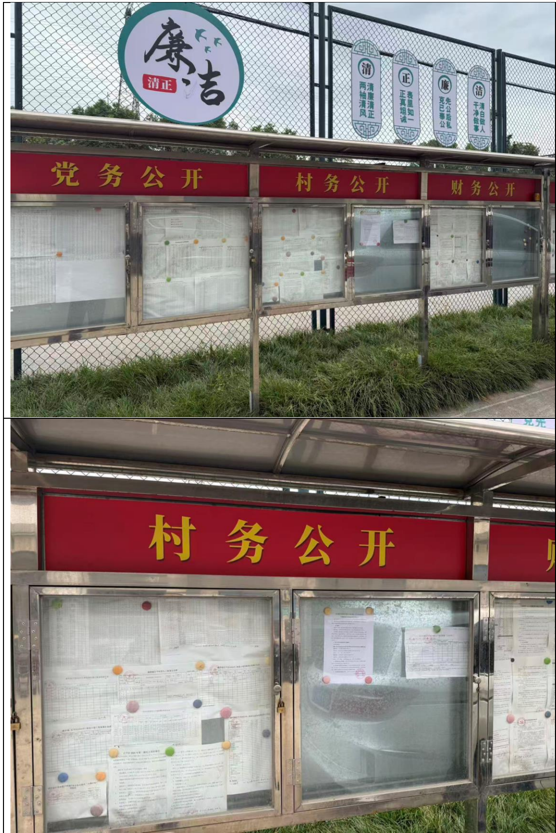
图 3.2-3 现场张贴公告照片