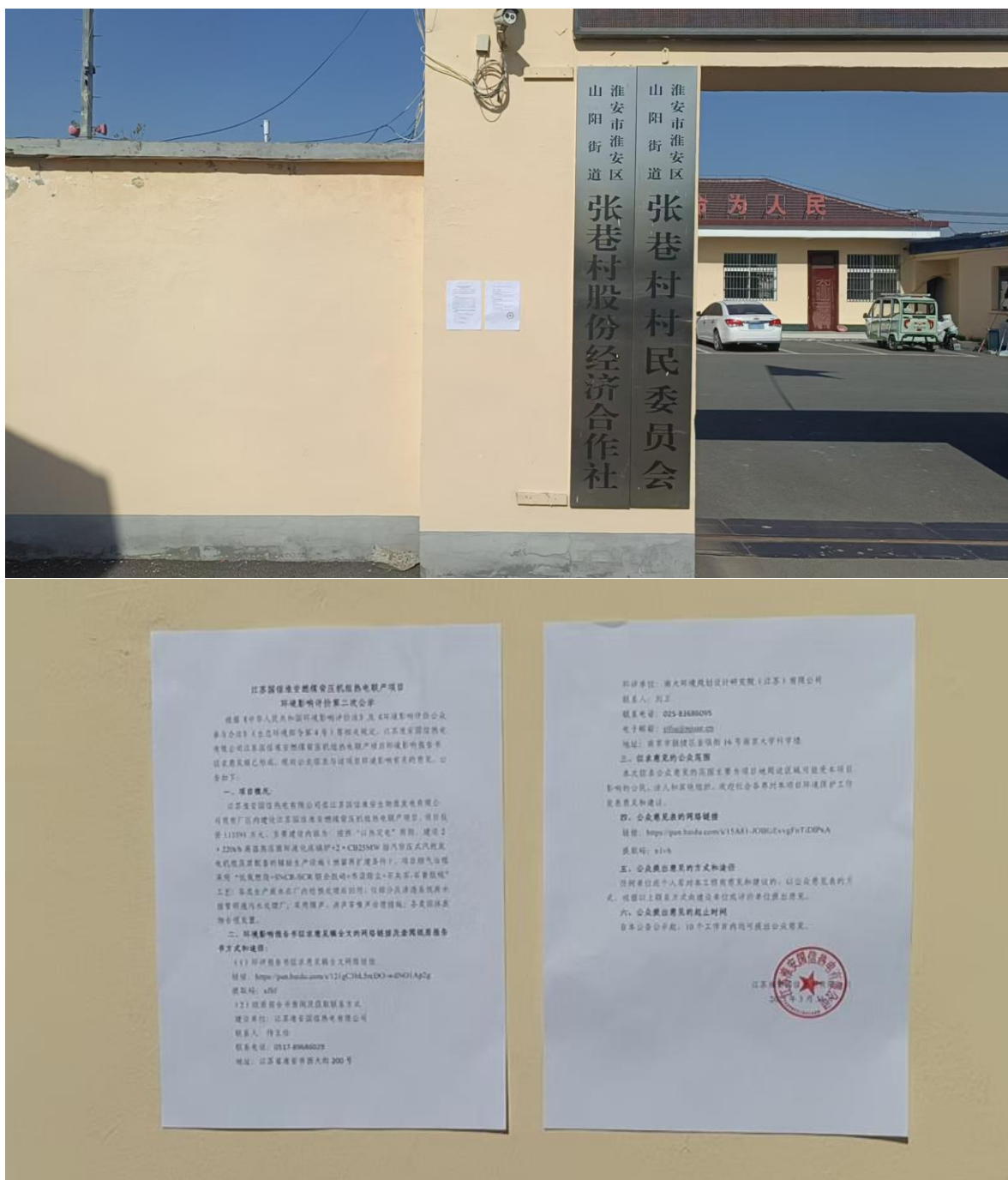
图 6 张巷村张贴公示截图