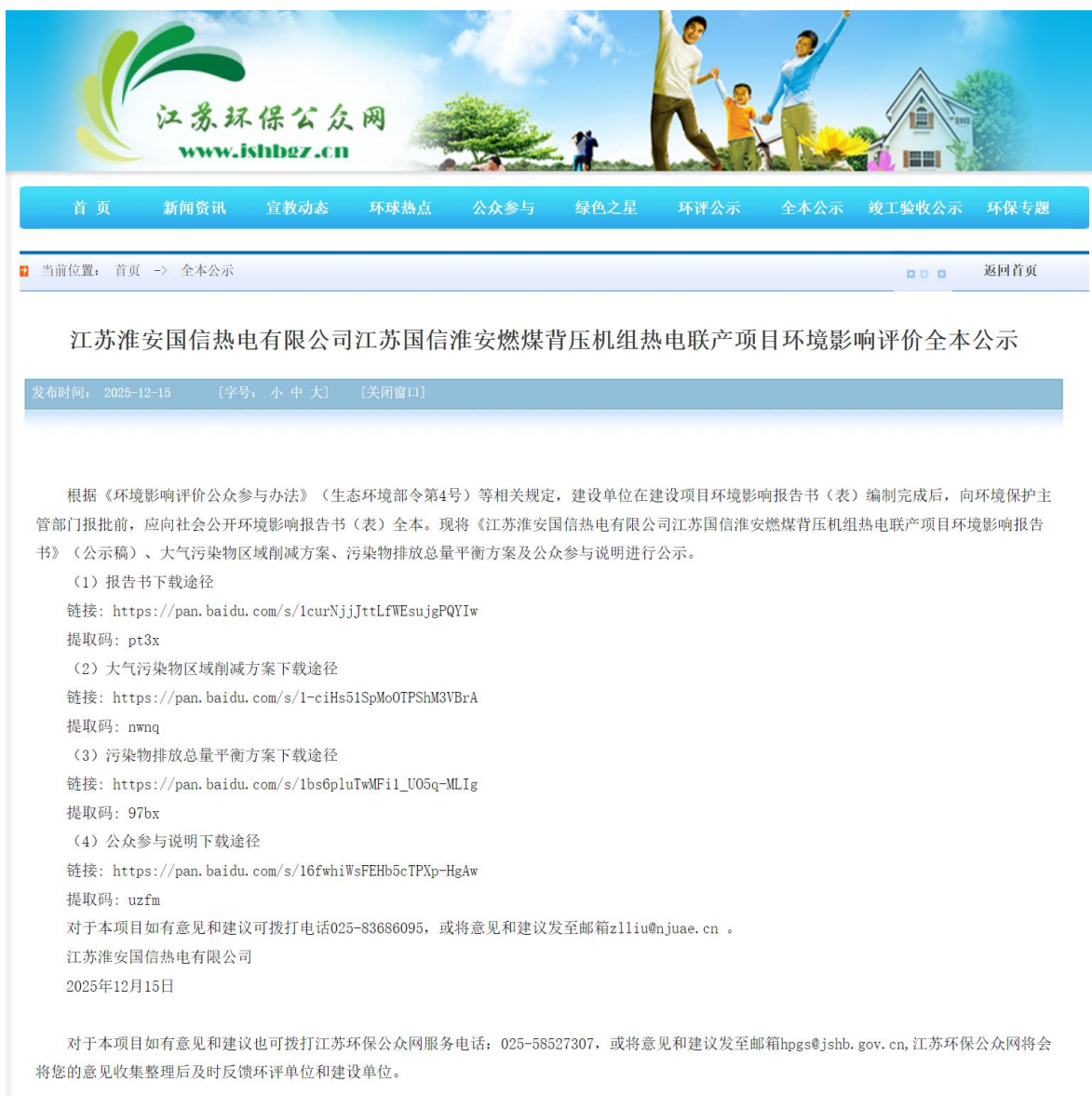
图 5-1 报批前网络公示截图