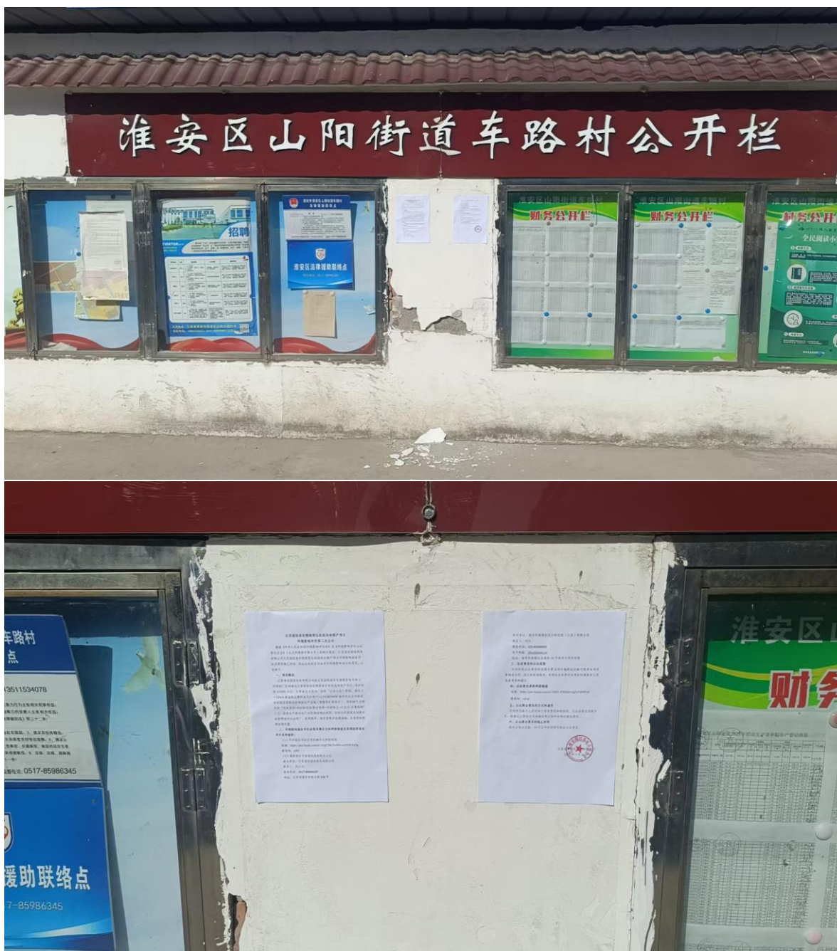
图 7 车路村张贴公示截图