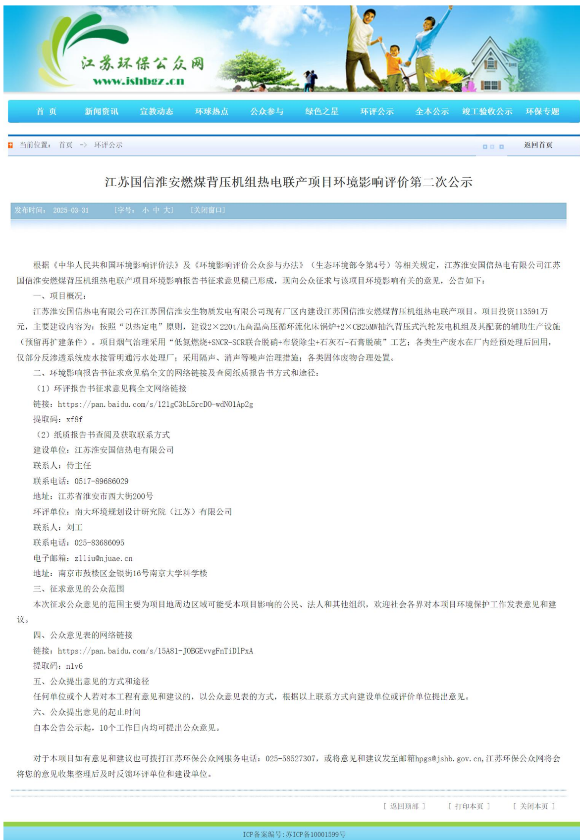
图 2 征求意见稿网上公示截图