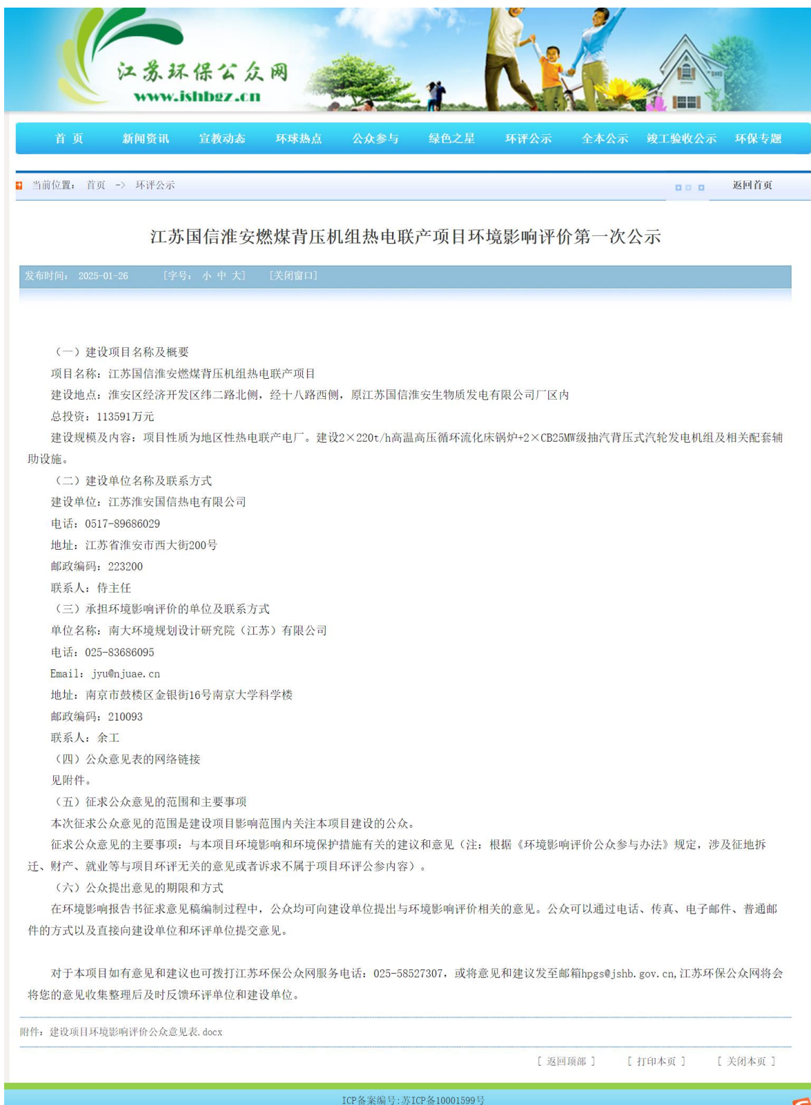
图1 网上首次公示截图