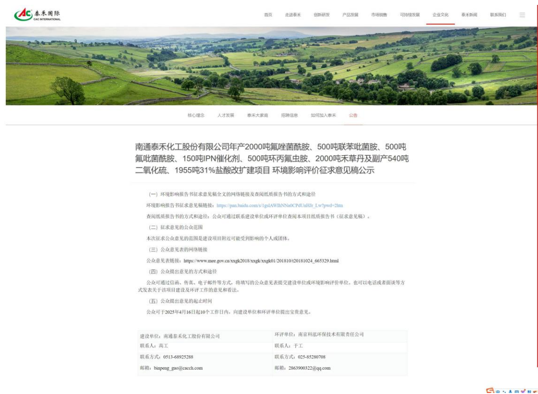
图 2 本项目征求意见公示网站公示截图