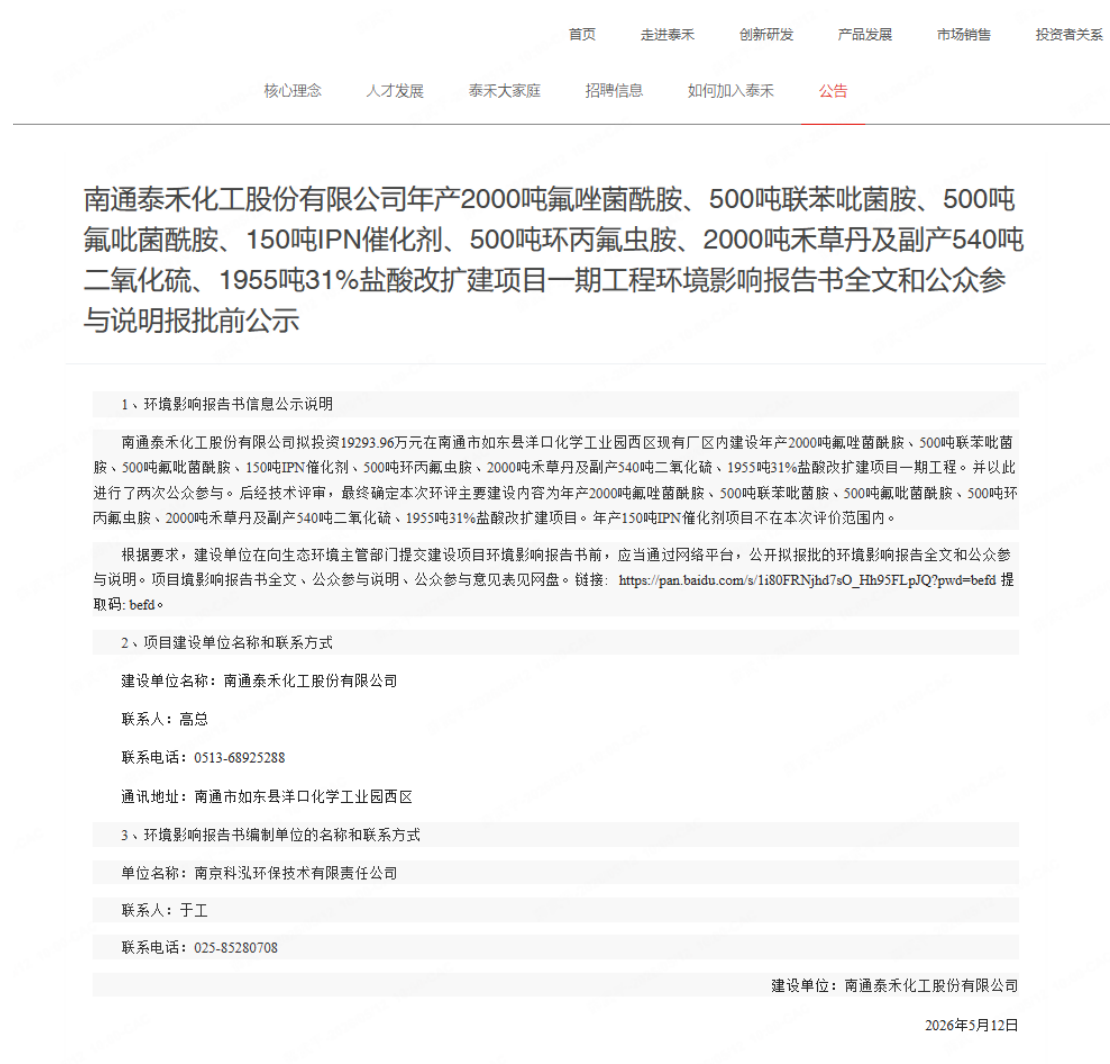
图 6 本项目报批前公示截图

南通泰禾化工股份有限公司网站为建设单位网站，符合《环境影响评价公众参与办法》要求