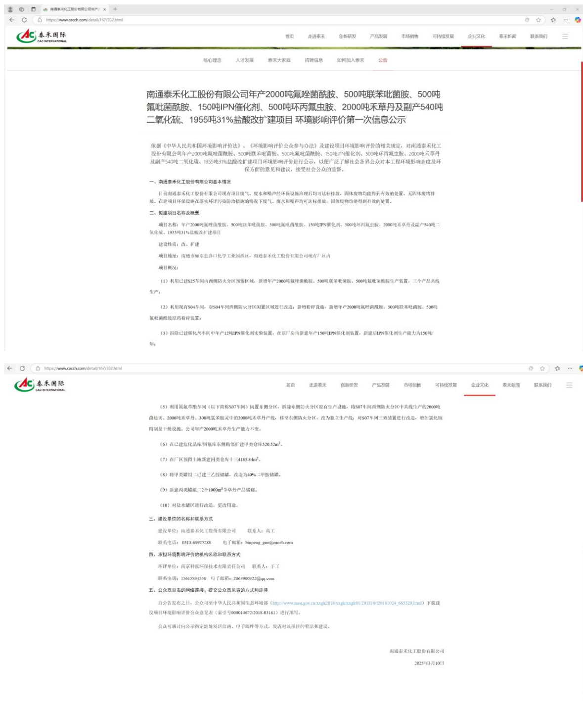
图 1 本项目首次公示网站截图