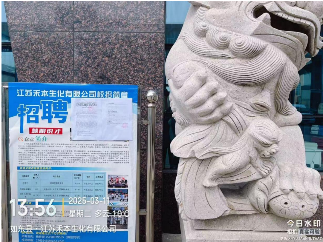
图 3.2.3-3 建设项目张贴公示照片（公司内宣传栏）