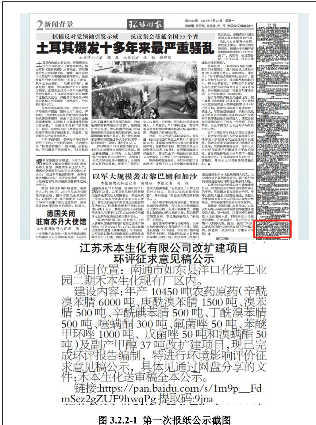
图 3.2.2-1 第一次报纸公示截图

2025年3月24日至2025年3月25日，企业分别在“环球日报”报纸上对建设项目进行了报纸公开，公示次数为两次，公开的主要内容包括：建设项目情况简述；公众索取信息的方式；公众提出意见的方式和途径；征求公众意见的范围和提出意见的起止时间。公开截屏见图 3.2.2-1、图 3.2.2-2。报纸公开期间未收到公众反馈意见。