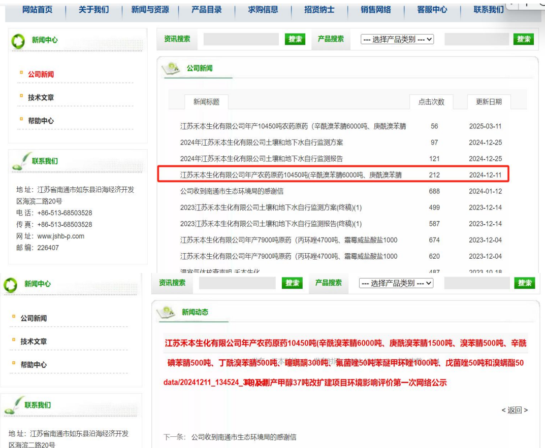
图 3.2.1-1 建设项目第一次公示截图

对照《环境影响评价公众参与办法》第九条,首次公开内容和形式符合《环境影响评价公众参与办法》中的相关要求。公示截屏见图 3.2.1-1。网络公示期间未收到公众反馈意见。