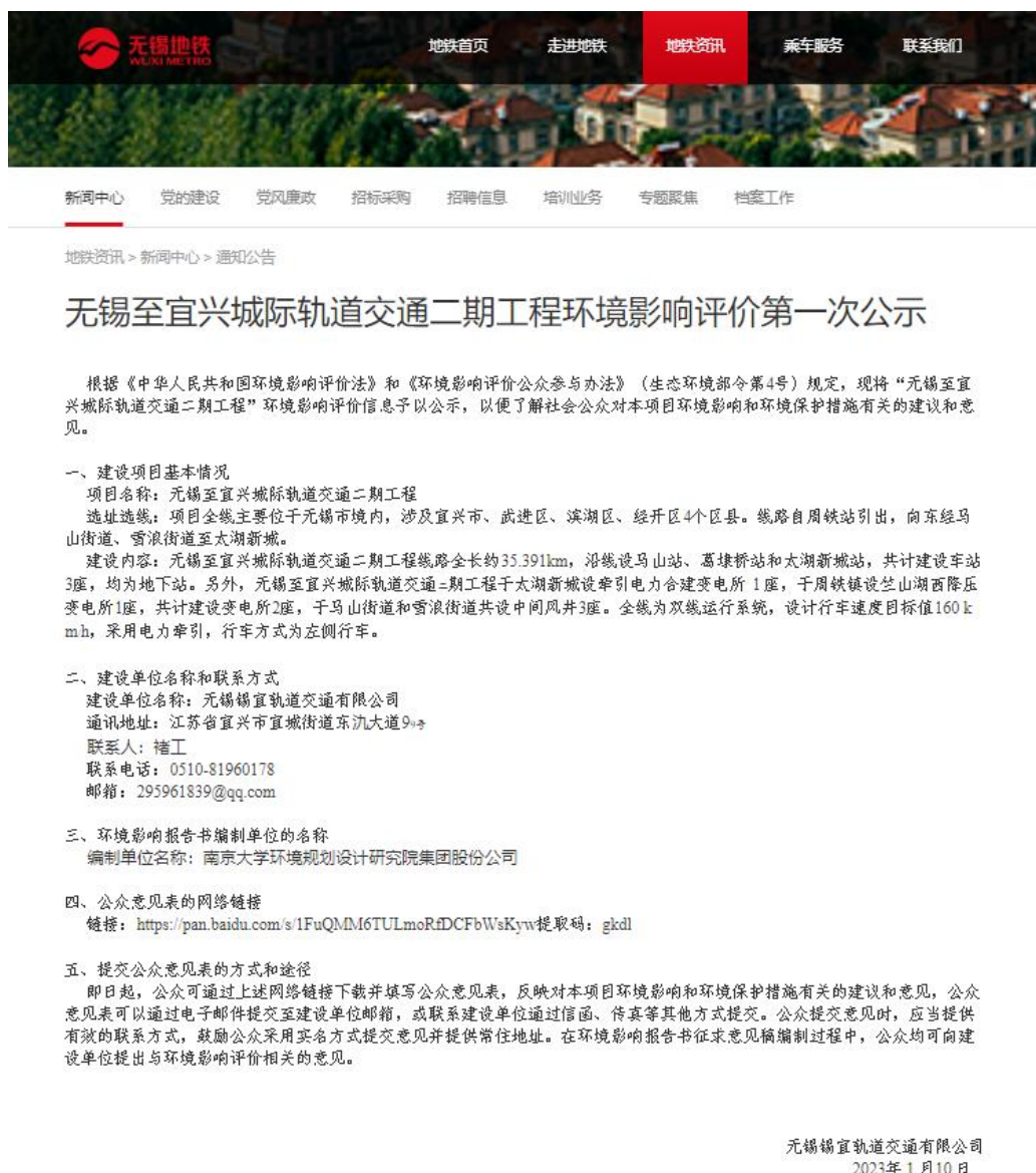
图 2.2-1 第一次信息公示网站截图