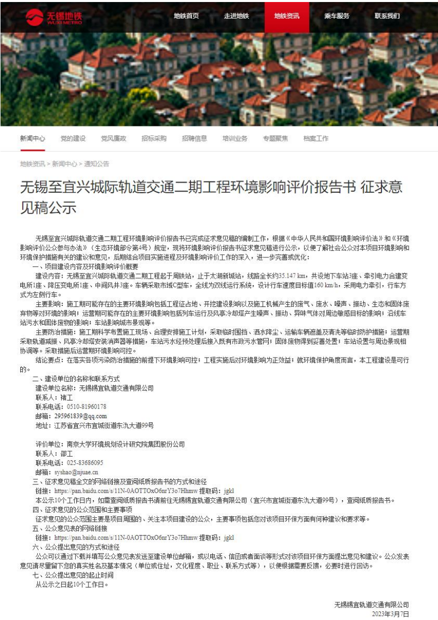
图 3.2-1 第二次信息公示网站截图