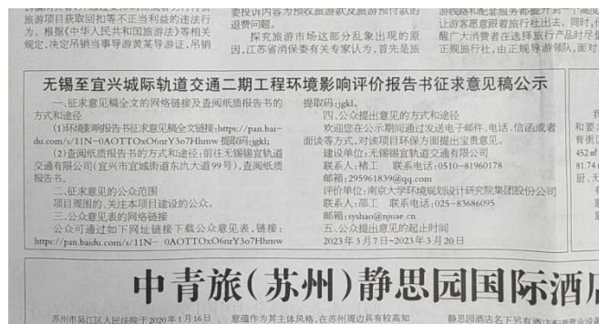
图 3.2-2 征求意见稿第一次报纸公示截图