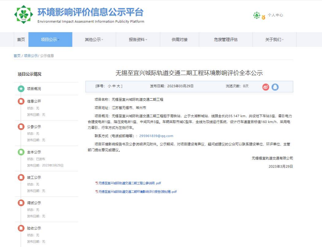
图 6-1 全本公示截图

响报告书》及《公众参与说明》，并对报告书中涉及商业秘密、个人隐私的内容进行了删减，符合《环境影响评价公众参与办法》（生态环境部令第4号）要求。